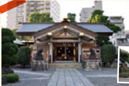
天祖諏訪神社(左) 街道松の広場(下)

東海七福神をめぐりながらぜひ集めたいのが、大正～昭和の郷土玩具研究家・有坂与太郎が企画した七福神の宝船。最初の社寺で木製の舟(900円)とその社寺に祀られている御神像(300円)をいただき、以後御神像を一鉢ずつ集めて宝舟を完成させましょう! なお、各社寺にも一揃の七福神宝舟(3,000円)があります。