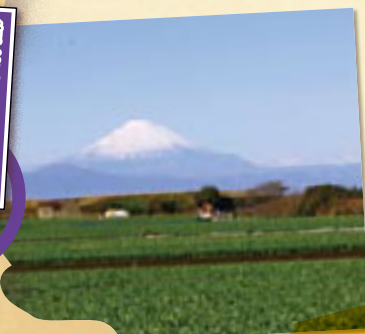
三戸の大根畑から望む富士山 (三浦七福神コース)