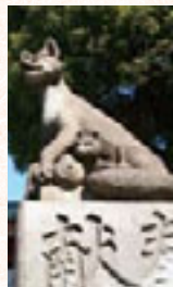
穴守稲荷神社狐像

赤い鳥居と狐がシンボルの稲荷神社。京都市の伏見稲荷大社を総本社とし、全国に3万社もあると言われています。もともとは農業神ですが、商業神、屋敷神ともなり、現在は五穀豊穰、商売繁昌、家内安全、芸能上達等の守護神として広く信仰されています。