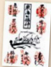
東海七福神御朱印